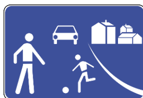
H46 - Zona residencial ou de coexistência.

* Zona concebida para utilização partilhada por peões e veículos, onde a velocidade máxima permitida é de 20 Km/h. Sinal de Zona de Coexistência: